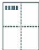
Étape 1 Step 1